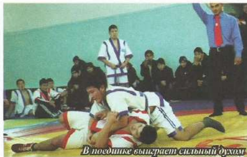
В поединке выигрывает сильный духом

центра «Ахыска» и членом Ассамблеи народа Казахстана Жамбылской области. С 1999 года и по сей день он руководит Меркенским филиалом ТЭКЦ. Немало масштабных ярких мероприятий на счету этого общественного объединения: участие в государственных и народных праздниках, фестивале дружбы, единства и культуры, конкурсах, олимпиадах по государственному и турецкому языкам и проведение за-