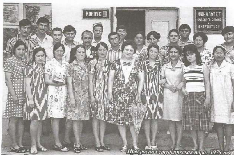
Прекрасная студенческая пора. 1978 год

«Меня очень волнуют трудности работы с молодежью, на селе почти нет работы, отсутствуют перспективы, вот и приходится им уезжать в другие города и в Турцию в поисках заработка, - говорит 76-летний старейшина. – Надо ведь семью кормить, детей на ноги ставить. Но мы старики тоже не сидим без дела, помогаем по хозяйству, умудрившись внуков учим – очень хочется, чтобы они стали хорошими людьми и не сворачивали с правильного пути. Самое главное, чтобы молодежь никогда не употребляла алкоголь и наркотики. Это самое страшное зло».